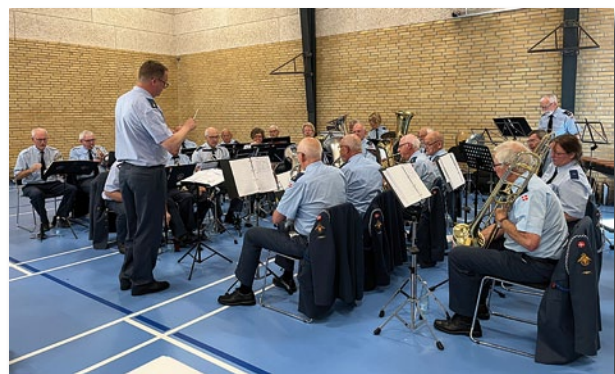
Flyvestation Aalborgs Brass Band