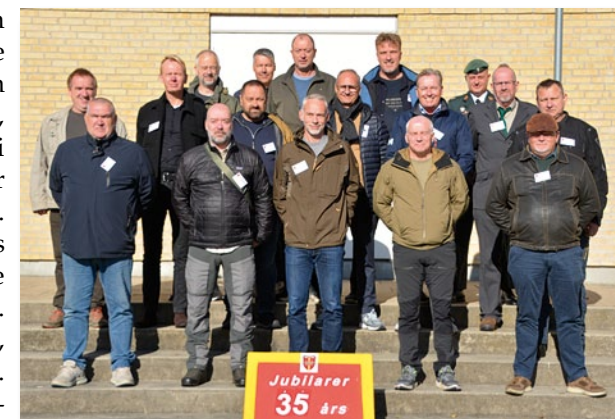
Holdfoto på trappen ved gymnastiksalen. Her 35 års jubilæarerne

Så skulle jubilæarerne over til trappen ved gymnastiksalen, hvor foreningens cheffotograf, Kurt Frederiksen stod klar til at knipse et gruppefoto af de enkelte årgange. I ventetiden kunne man så mindes løbeturene på banen udenfor og FUT - timerne i gymnastiksalen, hvor sveden kom til at hagle af en, medens en skrap gymnastiklærer animerede til,