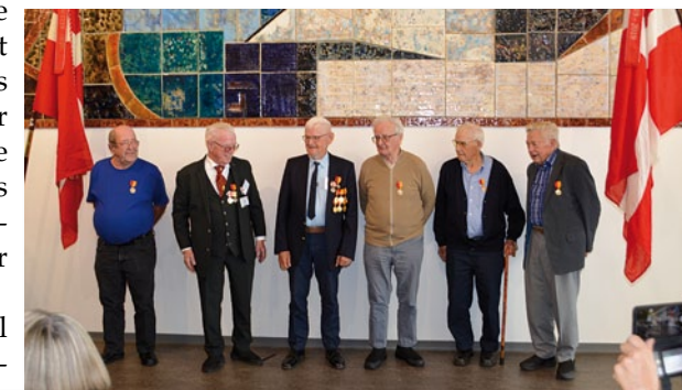
Årgang 54'ere med 70 års medaljen

Heldigvis viste det sig ikke at være tilfældet, for senere blev der serveret anden gang med schnitzler og det hele.