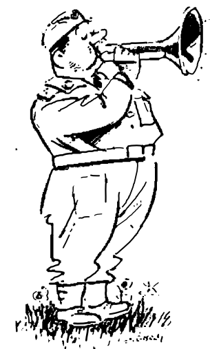
Menig 66 blæser honnør