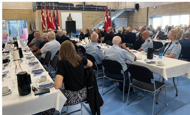
Der lyttes intenst

nye måder at anvende vores erfaringer på, og i at dele de værdifulde indsigter, man har fået med dem, der måske ikke har haft de samme oplevelser.