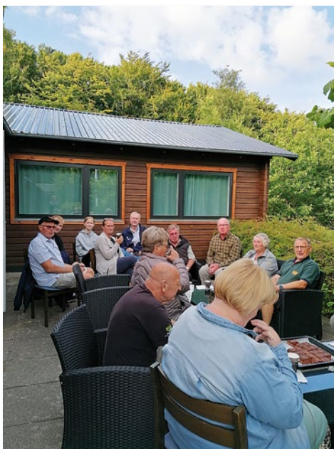
Hygge med kaffe og kage

Som skytteformand kunne jeg konstatere, at der var 11 skytter, som havde gennemført skydningen efter Danske Soldaters Landsråd (DSL) regler, og dermed kunne deltage i 50 m turneringen.