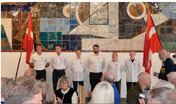
Tak til høflig og venlig betjening

Så kaldte formanden på konstabeleleverne; de blev under forsamlingens applaus dekoreret med foreningens bronzemedalje som tak for deres store hjælpsomhed med at få servering og afrydning bed bordene til at glide gelinde.