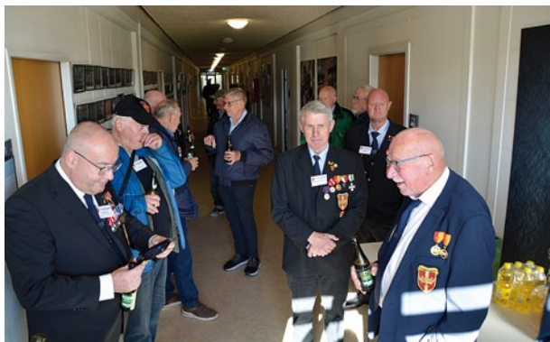
Der var mulighed for at købe en forfriskning i bygning 11

I dag huser bygningen MP-elever, og på en af stuerne viste elev sin hypermoderne beklædning og udrustning frem. Det var kræs, og mange af de gamle fra Dronningens tænkte, at det var lækkert at have haft sådan noget grej, dengang de gik til soldat.