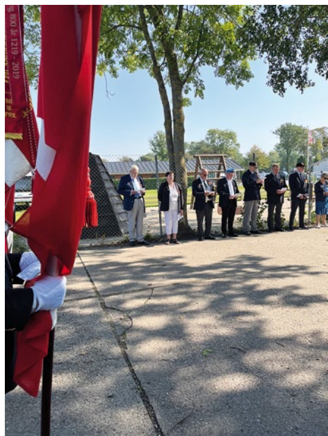
Der synges ved Soldatens Sten

af flagdagen for de indbudte veteraner. Her var flaget hejst, der var stillet et partytelt op på plænen foran hjemmet, og KFUM's Soldaterhjem havde gjort