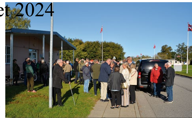
Udlevering af navne- /årgangsskilte ved den gamle hovedvagt

Jubilarene mødte som vanligt ved Dronningens Port, hvor der allerede ved halv ti tiden havde dannet sig en bilkø. For henne ved porten stod nogle venlige vagter fra Trænregimentet, der lige skulle kontrollere, at folk stod på deltagerlisten og udlevere et armbånd, der legitimerede, at man deltog i jubilarstævnet; man kan jo ikke bare lukke hvem som helst ind på kasernen. Men det gik nu gelinde, og så kunne folk samle sig oppe ved den gamle hovedvagt, hvor gamle soldaterkammerater snart fandt hinanden og kom i en god snak.