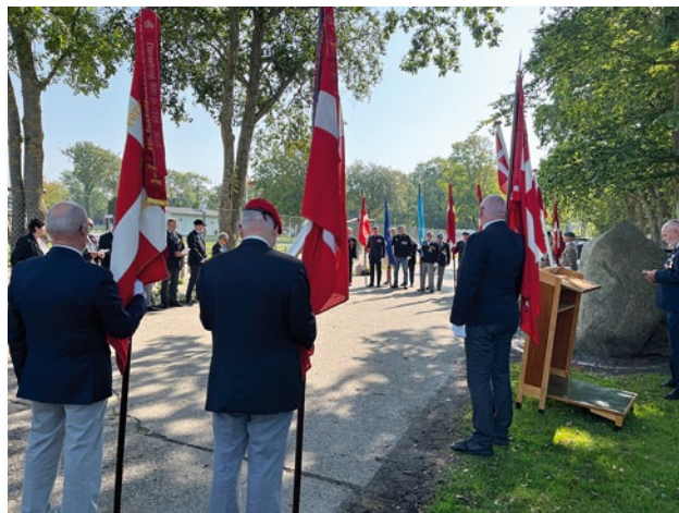
Fanerne ved stenen

bevare denne frihed, der ikke er gratis, men kræver dedikation og styrke. Soldaterne, som vi fejrer i dag har brugt deres liv på at beskytte vores nation. Vi skylder dem vores dybeste taknemmelighed for deres tapperhed og dedikation.