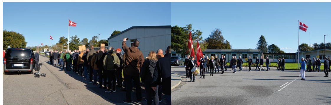
Klargørring til indmarch